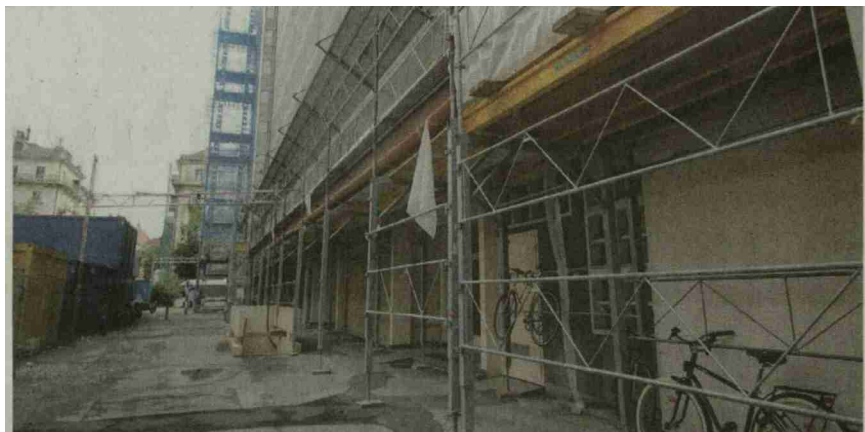
Depuis que l'immeuble à la Jonction est en travaux, les allées sont devenues des dépotoirs. OR

JONCTION • Une régie a envoyé une lettre peu ragoûtante à des locataires après la découverte de déjections dans les cages d'escalier. Un rappel à l'ordre qui passe mal. Excuses du régisseur.